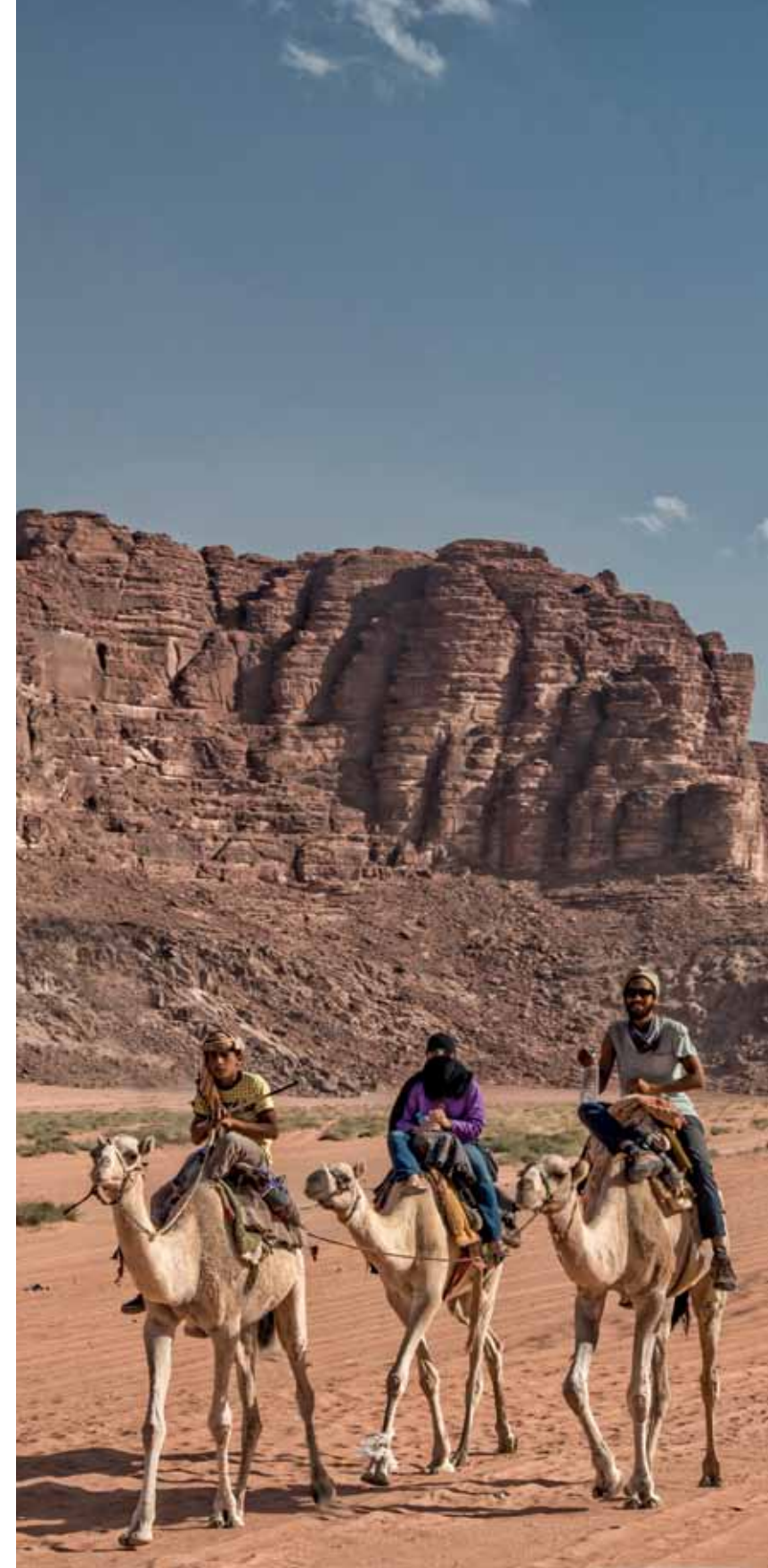
O dromedário era o principal meio de transporte dos antigos beduínos. Hoje, ele é usado apenas em passeios turísticos