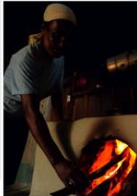
REPORTAGEM Sobre o projeto de transporte de produtos locais para o mercado remoto, veja tudo o que precisa saber sobre o assunto.

Além disso, a cidade possui uma infraestrutura completa, que inclui escolas, hospitais, supermercados, entre outros. Isso ajuda a melhorar a qualidade de vida dos moradores e a atrair investimentos para a cidade.