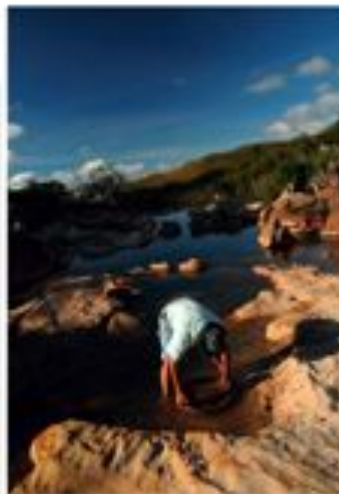
UMA GRANDE HISTÓRIA, CONTADA POR UM VELHO HOMEM QUE MORAVA AQUI HÁ MUITOS ANOS.

Uma grande história, contada por um velho homem que mora aqui há muitos anos. Depois de atravessarmos o rio, chegamos a um sítio arqueológico com algumas construções. Depois de atravessarmos o rio, chegamos a um sítio arqueológico com algumas construções.