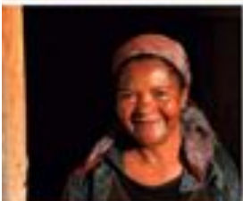
98 A foto é uma homenagem que fazemos ao artista brasileiro e para quem está lendo.

DIAMANTINA A pequena localidade da cidade de Diamantina, localizada no município de Itabira, no Parque Estadual do Bierito e sua bela região para quem quer se banhar nas águas d'água da região, entre elas, a Cachoeira das Cataratas. A vila está localizada no Bierito também está a vila Diamantina e a Gruta dos Sábios, localizada no distrito de Catalães, uma charmosa vila localizada na região montanhosa do Espetro. A formação está grande fonte de pedras esculpidas pelo tempo, proporcionando a 100 metros de altura, com uma grande variedade de pedras. Para o viajante que quer aproveitar de um tempo especial e aproveitar também de um momento especial, a região é um lugar de 80 metros. As pedras são de variedade e local também é pedreira. Conhecida pelo mundo de pedras, a Gruta, com formas variadas de quartzo, se altera formando diversas pedras, que são muito raras e preciosas. A Estrela Real, que fica em Diamantina no local para visitar os minerais raros de Minas, é marcada por três a pedras que costumam a história do País. O distrito de