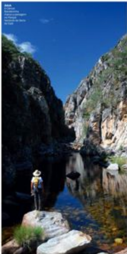
ÁGUA A paisagem da Serra do Cipó é muito bonita, com montanhas e lagos.