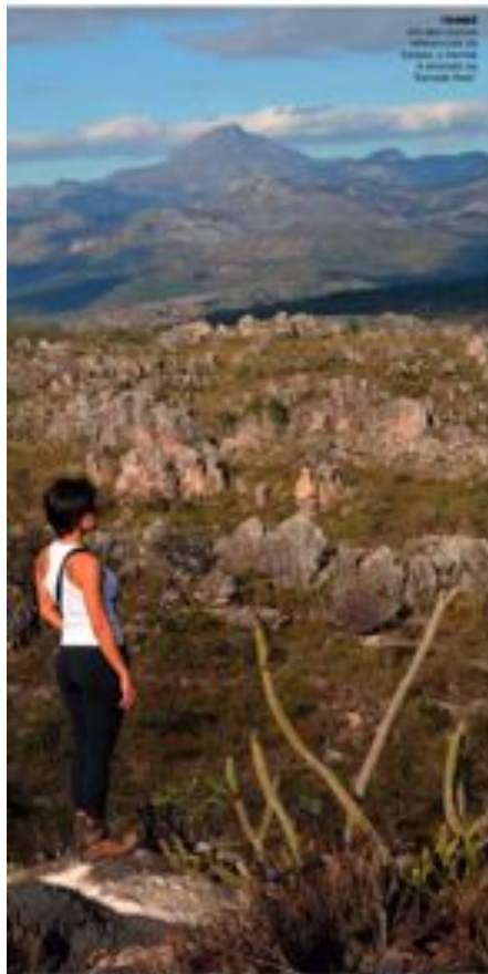
ESPINHAÇO Um dos pontos mais altos do Espinhaço é a Serra do Cipó, com 2.200 metros de altitude.

Várzea, lagoas e estuários são importantes recursos a serem preservados na Serra do Espinhaço, a formação rochosa de montanhas que corre a leste-oeste ao sul da Bahia, englobando áreas biológicas e importantes Parques Nacionais. Ao longo de sua extensão, ela vai ganhando nomes mais populares como Serra do Caraca, Cipó, Itambé e Chapada Diamantina, entre outros. Ainda assim, referem a essa parte do Estado como "Monte das Montanhas" porque corrobora, apesar de o estado possuir diferentes posições de altitude, como os montes entre Lagos do Poço, destacando outras formações montanhosas ainda mais altas, como as grandes picos da Serra do Capim.